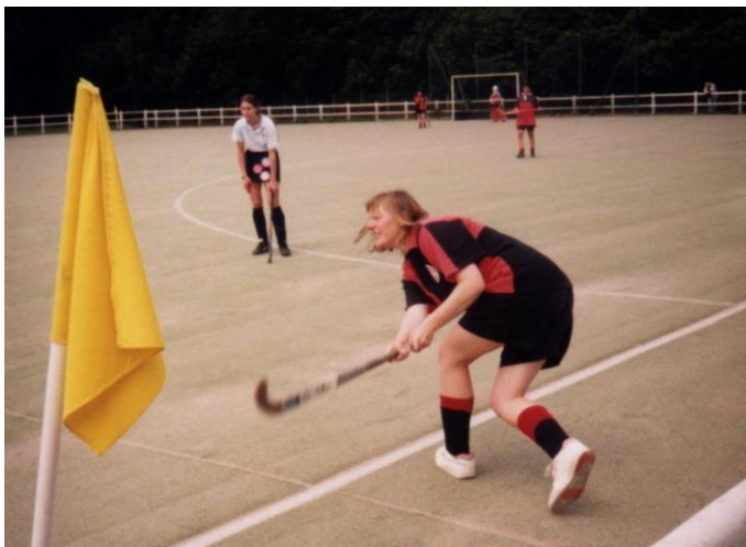
Standard Athletic Club - British School of Paris női műfüves mérkőzés 1996-ban