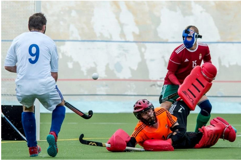
Finnország - Magyarország mérkőzés a finnországi férfi EB-n 2019-ben