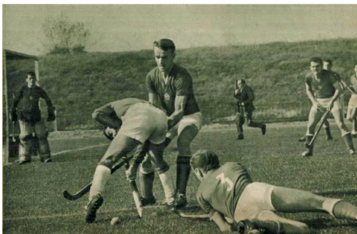
Magyarország - Olaszország válogatott mérkőzés 1966-ban

1957-től a szövetség nagy erőket mozgósított, hogy a magyar gyeplabda újra bekerüljön a nemzetközi vérkeringésbe. Kilencéves szünet után, 1958-ban játszhatott újra hivatalos mérkőzést a magyar válogatott. Az ellenfél Lengyelország volt, a végeredmény 7:0-ás vereség. A '60-as években a válogatott váltakozó sikerrel szerepelt, de ebben az időszakban is születtek kiemelkedő eredmények. A legnagyobb sikert 1966-ban könyvelhette el a magyar gyeplabdacsapat. A válogatott óriási meglepetésre megnyerte a Torinóban megrendezett négy csapatos nemzetközi gyeplabdatornát, a Zovato-kupát. A magyar csapat Belgiummal 1:1-es döntetlent játszott, Olaszországot 1:0-ra, Portugáliát pedig szintén 1:0-ra győzte le.