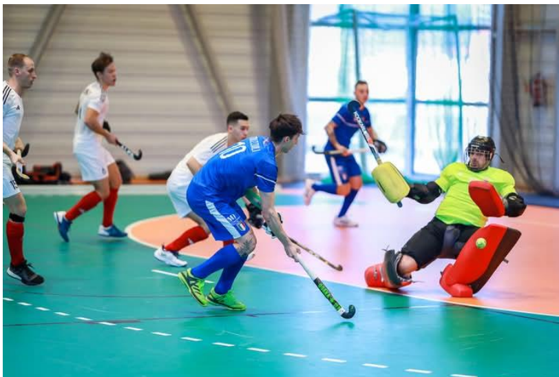
Magyarország - Olaszország mérkőzés a budapesti férfi terem EB-n 2024-ben