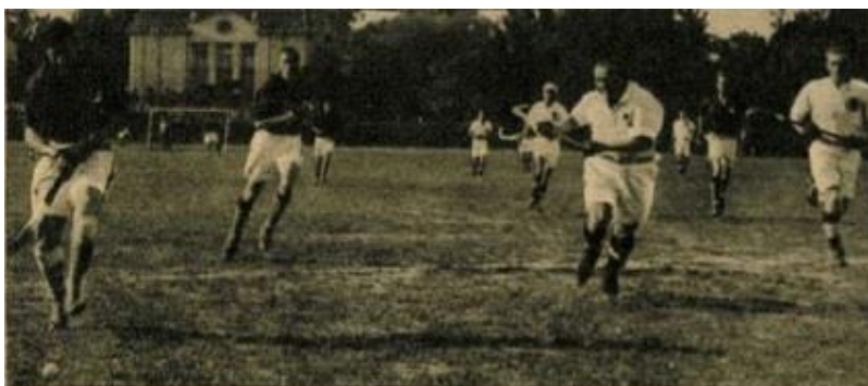
A magyar-svájci (3:2) válogatott gyephoki-mérkőzés egy jelenete: a sötétínges svájciak támadnak.