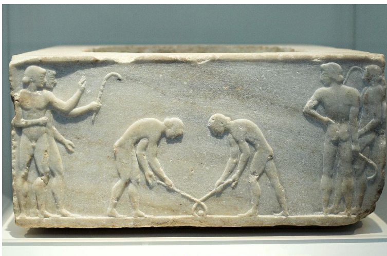
Görög dombormű a keretizontes nevű labdajátékról, Kr.e. 510 körül

Vagyis a kezdetekről szólva egy dolgot biztosan tudunk: azt, hogy nem tudjuk kik voltak az elsők. Viszont az is biztosnak tűnik, hogy a labdával és ütővel folytatott különböző csapatjátékok a világ több pontján – gyakran egymástól függetlenül – már az ókorban kialakultak.