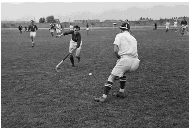
Magyarország - Csehszlovákia válogatott mérkőzés 1949-ben

időre ez lesz a nemzeti csapat utolsó fellépése. Sőt a gyepabda hívei hamarosan kénytelenek voltak rájönni, hogy az élet valóban nem habos torta, mert szép lassan a legtöbb sportegyesületből – felsőbb nyomásra – kiszorították a gyephokit. 1954-ben már csak négy csapat indult a bajnokságban, majd a következő évben a Bp. Kinizsi és a Bp. Szikra is megszüntette a gyepabda-szakosztályát. 1956-ra már csak két egyesület maradt, ahol még létezett gyepabdacsapat: a Bp. Építők és a Törekvés. Így ebben az évben a bajnokságot sem tudták kiírni. Úgy tűnt Magyarországon a gyepabda sírba szállt.