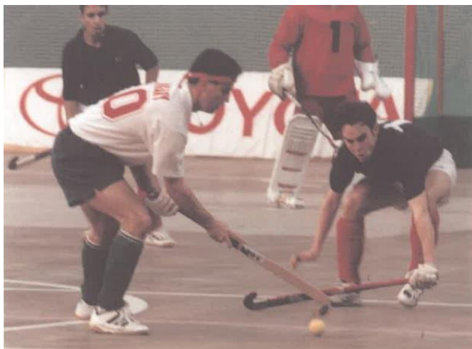
Magyarország - Franciaország mérkőzés a Portóban rendezett terem EB-n 1999-ben