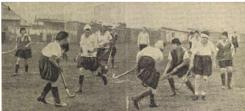
Az első női mérkőzés Magyarországon a MAC és az MHC csapatai között 1925-ben