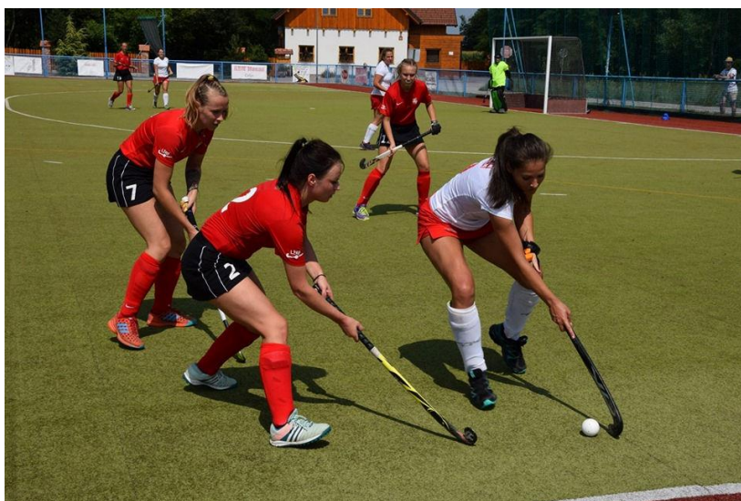
Litvánia - Magyarország mérkőzés a szlovéniai női EB-n 2019-ben