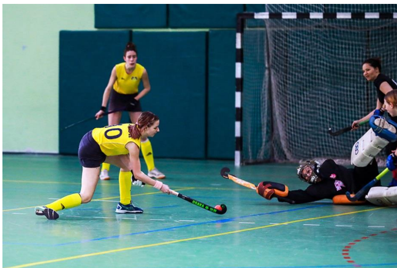
Amatőr HC - BKGDSE-Fasor női teremhajóknoki mérkőzés 2024-ben

A női bajnokságra – egy népmesei fordulattal élve – azt mondhatnánk, hogy hol volt, hol nem volt. A 2000-es évek elején volt, amikor megrendezték a nagypályás és teremhajóknokságot is, volt, amikor csak teremben játszottak a hölgyek, és volt, amikor semmilyen bajnokságot sem írtak ki. Mindez nyilván attól függött, hogy éppen aktuálisan mennyi női csapat űzte aktívan a sportot. Amikor nem került sor a magyar bajnokság kiírására a működő csapatok akkor sem pihentek, hanem különböző nemzetközi tornákon vettek részt, ezzel is életben tartva a női szakágot. Űde színfolt volt ebben az időszakban, hogy egy főleg helyi jégkorongozókból álló kazincbarcikai csapat is szerepelt néhány alkalommal a teremhajóknokságban. 2015 óta már rendszeresen megrendezésre kerül a női bajnokság is teremben és műfűvön is – utóbbiban igaz csak szűkített formátumban, de 2022-től már háromnegyed pályán 9 fős (8+1-es) csapatokkal – ahol az Amatőr HC sorozatban gyűjtötte be a bajnoki címeket mind nagypályán, mind teremben. Ezt a szériát előbb a Szent László csapata tudta megtörni a 2022/23-as műfűves bajnokságban, majd a 2023/24-es szezonban a BKGDSE-Fasor HC együttese a nagypályás és a teremhajóknoki címet is elhódította.