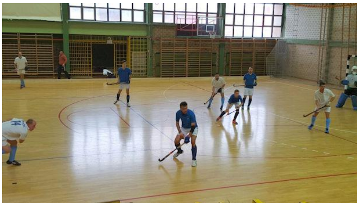
Nemzetközi teremtorna egyik mérkőzése Sveti Ivan Zelinában 2015-ben

1972-ben volt a gyephoki teremben, kézilabdapályán, hat fős csapatokkal játszott új változatának hivatalos bemutatkozása. Ez a verzió mind a játékosok, mind a nézők körében gyorsan népszerű lett. Az előbbieket azért, mert télen is lehetett játszani, a nézők számára pedig gyorsabb, látványosabb, jobban követhető játéknak bizonyult. Először 1974-ben a férfiak, majd 1975-ben a nők számára rendeztek teremhoki Európa-bajnokságot.