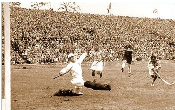
Németország - India mérkőzés az 1936-os berlini olimpián

először India válogatottja, akkori hivatalos nevén Brit-Indiaként. A többi nyolc résztvevő mindegyike európai volt, akik talán kicsit le is nézték a számukra teljesen ismeretlen „indus” csapatot. Az mindenesetre figyelmeztető jelként szolgálhatott volna, hogy Nagy-Britannia nem indult ezen a tornán. A sors iróniája, hogy az angol gyarmatosítók által Indiában meghonosított modern gyepabda rohamos fejlődésnek indult a brit korona ékköveként emlegetett országban. Persze könnyen talált termékeny talajra ez a sport, hiszen – mint láthattuk – Indiában már nagyon régóta játszottak hasonló játékokat. Mindenesetre a tanítványok hamarosan lehagyták a mestereket, melyet 1928-ban a szerencsétlen európaiak még nem tudhattak, de hamarosan megtapasztalhattak. India brutálisan átgázolt minden ellenfelén. Úgy szerezte meg az első helyet, hogy öt meccsen összesen 29 gólt lőtt és egyet sem kapott! Ezután India 1956-ig minden olimpiát megnyert, 1947-től már független államként. (Zárójeles megjegyzés, hogy az indiai függetlenségi mozgalomban a gyepabda is fontos és szimbolikus szerepet játszott, hiszen ez volt az egyetlen csapatsportág, amelyben az indiaiak a britek fölé tudtak kerekedni. Ennek következtében a gyepabda nemzeti üggyé vált.) Erre az időszakra elmondhatjuk – Gary Lineker 1990-es, a német focira vonatkozó megjegyzését átalakítva –, hogy a gyepabda egyszerű játék, 22 fickó kerget egy labdát és valahogy mindig az indiaiak nyernek. Erre a hegemoniára 1960-ban érkezett az első csapás.