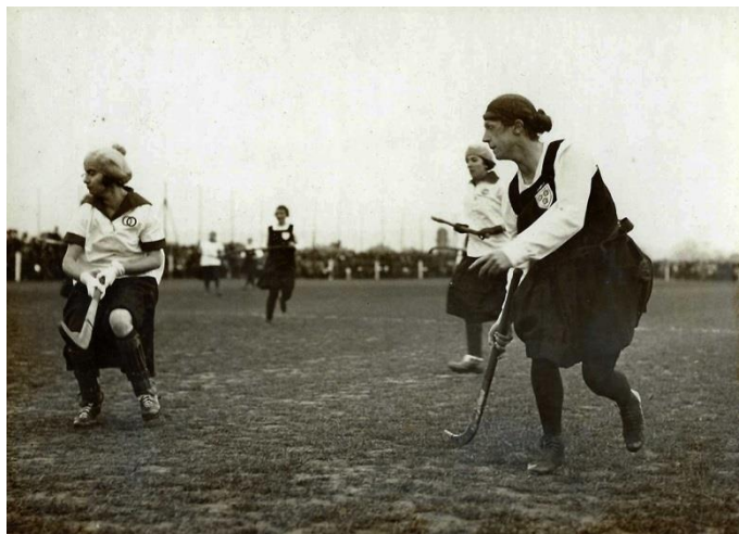
Anglia - Franciaország női válogatott mérkőzés 1923-ban

A következő fontos esemény az 1927-es évhez kapcsolódik, amikor a hölgyek is létrehozták saját önálló szervezetüket, a Nemzetközi Női Gyeplabda Szövetséget. (International Federation of Women's Hockey Association, röviden: IFWHA). Az alapítók között ott találjuk Ausztráliát, Dániát, Angliát, Írországot, Skóciát, Dél-Afrikát és az USA-t. Ezekben az országokban máig rendkívül népszerű a női gyeplabda. Példának okáért 1968-ban a londoni Wembley stadionban 60 000 néző(!) volt kíváncsi az Anglia-Hollandia női gyephoki meccsre. Az USA-ban pedig mind a mai napig kifejezetten női sportágnak tartják. Az IFWHA 1983-ig működött önálló szervezetként, amikor beolvadt a FIH-be.