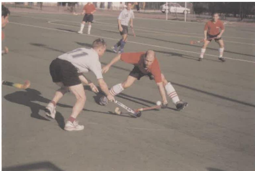
Építők - Rosco műfüves bajnoki mérkőzés 2000 körül

Ezt azért fontos hangsúlyoznunk, mert a magyar gyeplabdáról szóló írásokban a '90-es évekről általában méltatlanul kevés szó esik. Pedig a tények alapján, erről az időszakról szólva egy olyan történet bontakozik ki a szemünk előtt, amelyre a sportág minden kedvelője méltán lehet büszke.