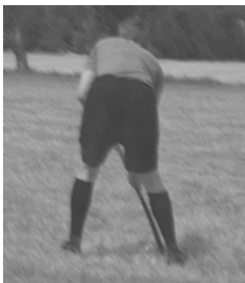
Gyephoki bemutató-mérkőzés Székesfehérváron 1919 júniusában

Aztán a Tanácsköztársaság megbukott, mindenki visszakapta a jogos tulajdonát, az MHC pedig engedélyt kapott a fővárostól az újonnan kialakított pálya használatára. Így 1919 őszén lebonyolódhattak az első magyar kupameccsek. A kupa győztese a MAC csapata lett.