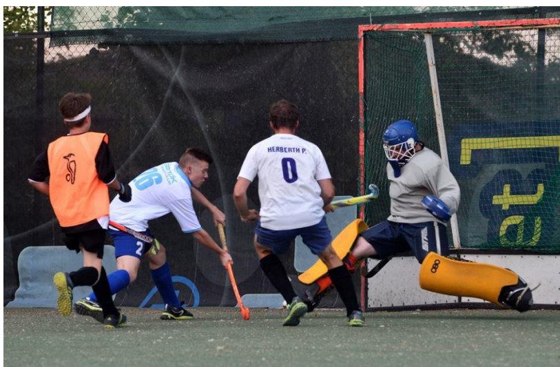
Főnix - Építők mérkőzés a HOLI5-ös bajnokságban 2017-ben

Szintén 2017-ben indult el az úgynevezett HOLI5 bajnokság, mely az országban elsőként alkalmazta a kispályás "Hockey5s" szabályrendszerét. A bajnokság a Főnix MSE gyeplabda-szakosztályának szervezésében indult le, majd annak megszűnése után a Piros-Fehér Hockey Club vette át a stafétabotot. Ennek a szabadtéri, kispályás bajnokságnak a magyar viszonyok között különösen kiemelt fontossága lehet, hiszen kis létszámú csapatok is játszhatják (vegyes férfi-női felállásban is), és akár egy iskolai műfüves pálya is helyszínül szolgálhat. Mind az idősebb, mind a fiatalabb játékosok számára szórakoztató és sikerélményekben gazdag lehetőséget kínál a sportág gyakorlására.