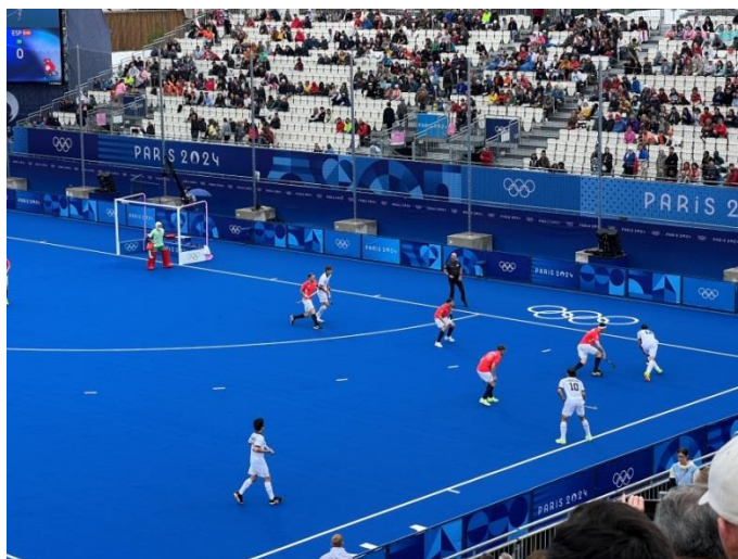
Nagy-Britannia - Spanyolország férfi mérkőzés a 2024-es párizsi olimpián

A műfünek köszönhetően gyorsabbá, látványosabbá vált a játék, melynek eredményeként fokozatosan változtak a szabályok (pl.: les szabály eltörlése) és folyamatosan fejlődnek az eszközök (pl.: műanyag labdák, kompozit ütők, új kapusfelszerelések megjelenése). A 2012-es londoni olimpián egy látványos újítással szembesülhettek a sportág rajongói. A televíziós közvetítések jobb élvezhetősége miatt kék színű borítással látták el a pályát, melyen fehér labdát kergettek a játékosok. A kedvező visszajelzéseknek köszönhetően a nagy világversenyeket azóta is ilyen színű pályákon bonyolítják le.