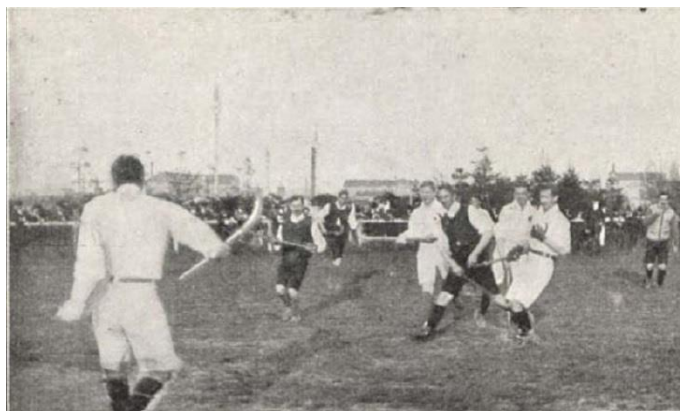
Az első hivatalos gyephoki meccs Budapesten 1907. május 05-én