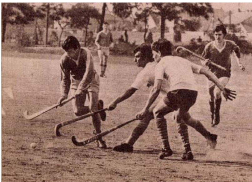
Kinizsi Sörgyár - Bp. Postás bajnoki mérkőzés salakon 1971-ben

így jól hangzik, a probléma viszont az volt, hogy egyik helyszín sem volt igazán alkalmas gyepabdázásra. Ezek lényegében focipályák voltak, viszont a gyephoki számára legideálisabb az úgynevezett „birkarágtá gyep” volt (ezt a „szakkifejezést” külön köszönöm Ferenczi Ferencnek, az MGYSZ jelenlegi alelnökének). Ez az egészen rövidre lenyírt fűvet jelenti, rövidebbet, mint ami a focipályákon szokott lenni. Azt is hozzá kell tennünk, hogy a játékosok gyakran már annak is örültek, ha egyáltalán fűvet találtak a játéktéren, mert többségében – mint a Népstadion edzőpályája – salakos borításúak voltak.