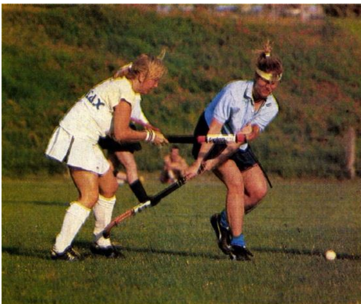
Novitax – Tabán női mérkőzés 1987-ben

aki hajlandóságot mutatott nevet adni és némi anyagiakat ránk szálni.” Tehát a kecskeméti Delikát SC tulajdonképpen csak nevet adott egy budapesti női gyeplabdacsapatnak, amely egyébként a MAFC sporttelepén tartotta edzéseit, és – más lehetőség hiányában – a fiú ifjúsági bajnokságban indult el. Ez a különös házasság aztán nem tartott sokáig, mert a hölgyek hamarosan Budapesten is találtak olyan egyesületet – a Movill Sport Clubot –, amely felkarolta a női gyeplabdát. 1987-ben már a Tabán SC és a Novitax Spartacus SE is rendelkezett női csapattal, amelyek nagypályán és teremben egyaránt játszottak nemzetközi meccseket is, még hozzá nem is eredménytelenül. Ezzel a magyar női gyeplabda szelleme megállíthatatlanul kiszabadult a palackból és szerencsére azóta is színesíti sportéletünket.