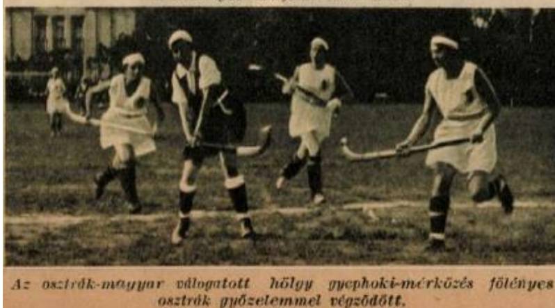
Az osztrák-magyar válogatott hölgy gyephoki-mérkőzés főlényes osztrák győzelemmel végződött.

Tudósítás a magyar-svájci férfi és a magyar-osztrák női meccsekről 1931-ben